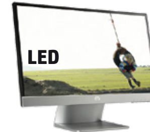
Pavilion 23xi (Ref.: C3Z94AA)