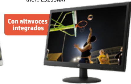
HP V241a (Ref.: E5Z95AA)