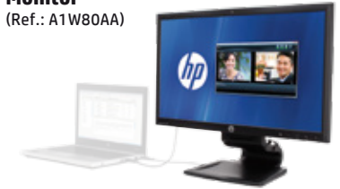
HP Compaq L2311c Notebook Docking Monitor (Ref.: A1W80AA)