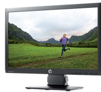
HP EliteDisplay E201 LED (Ref.: C9V73AA)