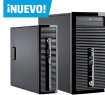
HP ProDesk 400 SFF/MT (Ref.: D5S21EA | D5T94EA)