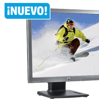
HP EliteDisplay E190i LED (Ref.: E4U30AA)