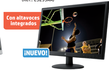
HP V241a (Ref.: E5Z95AA)