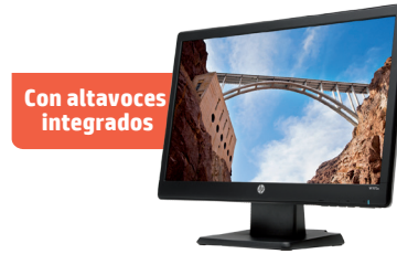
HP W2072a (Ref.: B5M13AA)