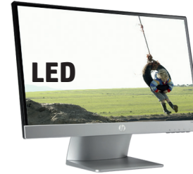
Pavilion 22xi (Ref.: C4D30AA)