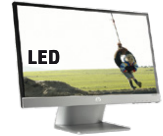
Pavilion 23xi (Ref.: C3Z94AA)