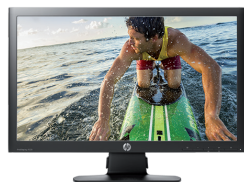
HP ProDisplay P221 LED (Ref.: C9E49AA)