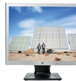
HP LA1956x LED (Ref.: A9575AA)