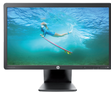
HP EliteDisplay E201 LED (Ref.: C9V73AA)