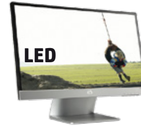
Pavilion 22xi (Ref.: C4D30AA)