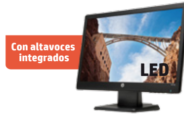
HP W2072a (Ref.: B5M13AA)