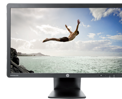
HP EliteDisplay E231 LED (Ref.: C9V75AA)