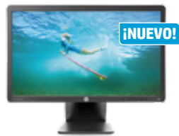
HP EliteDisplay E201 LED (Ref.: C9V73AA)