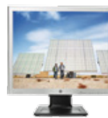
HP LA1956x LED (Ref.: A9575AT)