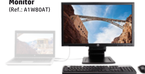
HP Compaq L2311c Notebook Docking Monitor (Ref.: A1W80AT)