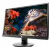
HP V214a (Ref.: 1FR84AA)