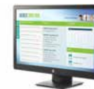
HP ProDisplay P223 (Ref.: X7R61AA)