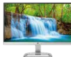
HP 22es (Ref.: T3M70AA)