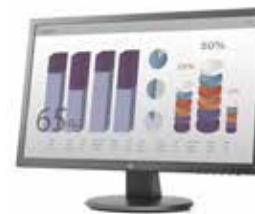
HP V243 (Ref.: W3R46AA)