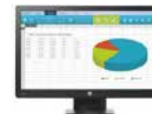
HP ProDisplay P203 (Ref.: X7R53AA)