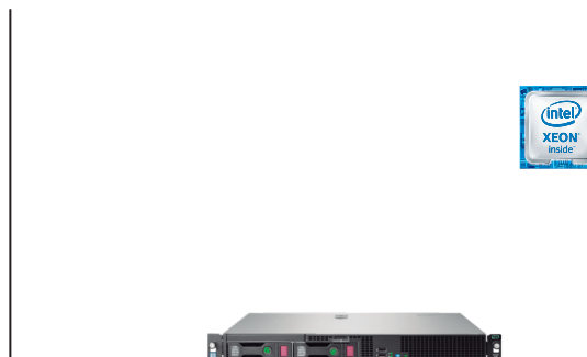
ProLiant DL20 Gen9