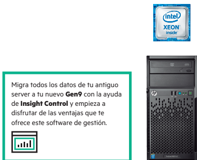
ProLiant ML10 Gen9