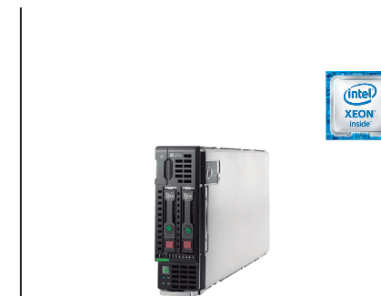
ProLiant BL460c Gen9