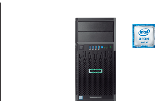
ProLiant ML30 Gen9