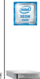
ProLiant DL180 Gen9