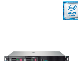
ProLiant DL20 Gen9