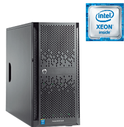
ProLiant ML150 Gen9