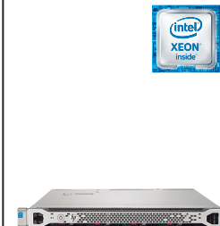
ProLiant DL360 Gen9