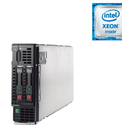
ProLiant BL460c Gen9