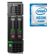
BL460C Gen9 Ref.: N2G74A