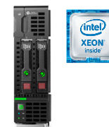
BL460C Gen9 Ref.: N1W94A