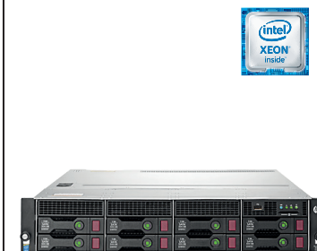
ProLiant DL80 Gen9