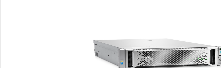
ProLiant DL180 Gen9