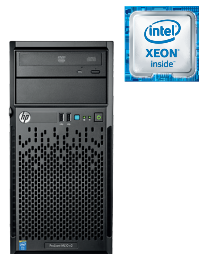
ProLiant ML10 Gen9