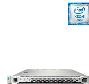
ProLiant DL160 Gen9