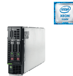
ProLiant BL460c Gen9