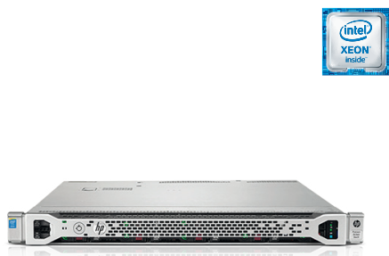
ProLiant DL360 Gen9