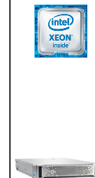
ProLiant DL180 Gen9