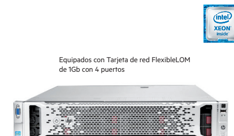
ProLiant DL380e Gen8

Equipados con Tarjeta de red FlexibleLOM de 1Gb con 4 puertos