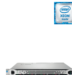
ProLiant DL360 Gen9