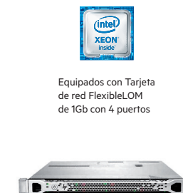
ProLiant DL360p Gen8

Equipados con Tarjeta de red FlexibleLOM de 1Gb con 4 puertos