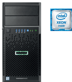
ProLiant ML30 Gen9