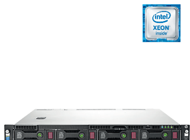
ProLiant DL60 Gen9