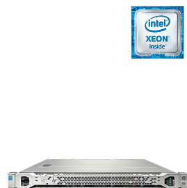
ProLiant DL160 Gen9