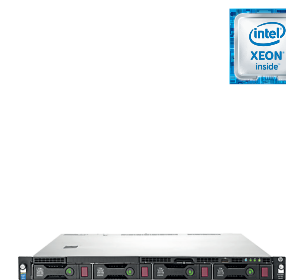
ProLiant DL120 Gen9