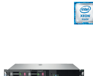
ProLiant DL20 Gen9