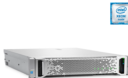
ProLiant DL380 Gen9