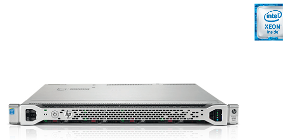
ProLiant DL360 Gen9