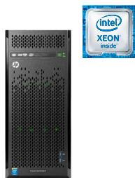
ProLiant ML110 Gen9