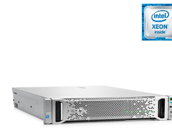
ProLiant DL180 Gen9