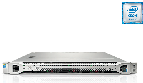
ProLiant DL160 Gen9