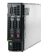
ProLiant BL460c Gen9