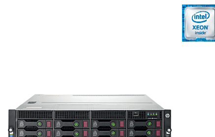
ProLiant DL80 Gen9