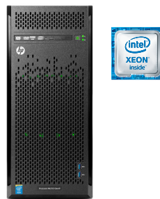
ProLiant ML110 Gen9