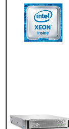
ProLiant DL180 Gen9