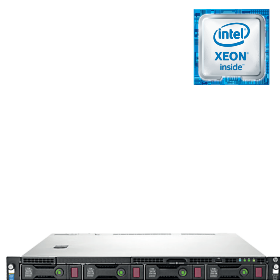
ProLiant DL60 Gen9