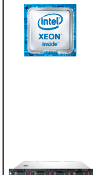
ProLiant DL60 Gen9