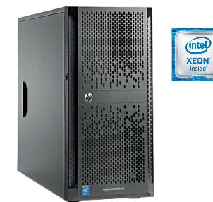
ProLiant ML150 Gen9