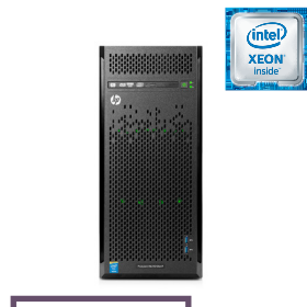
Con Windows 2012 Foundation ProLiant ML110 Gen9