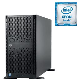
ProLiant ML350 Gen9