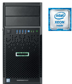
ProLiant ML30 Gen9