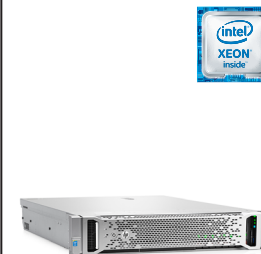
ProLiant DL380 Gen9