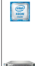
ProLiant DL160 Gen9