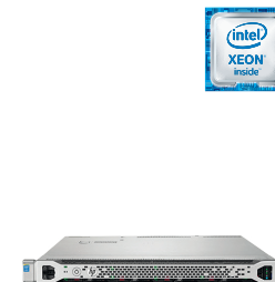
ProLiant DL360 Gen9