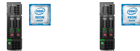
BL460C Gen9 Ref.: N1W94A