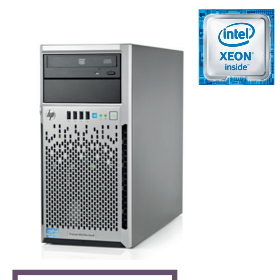
Con Windows 2012 Foundation ProLiant ML310e Gen8