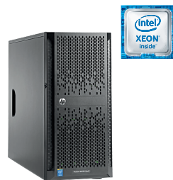
ProLiant ML150 Gen9