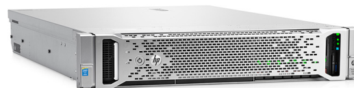
ProLiant DL380 Gen9