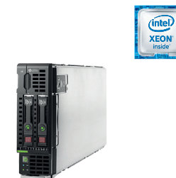
ProLiant BL460c Gen9