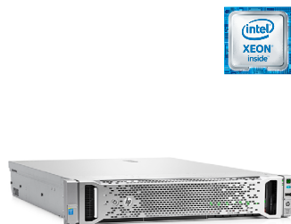
ProLiant DL180 Gen9