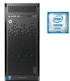
ProLiant ML110 Gen9