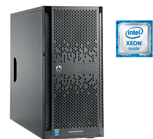
ProLiant ML150 Gen9