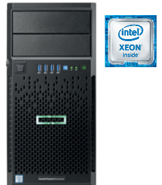
ProLiant ML30 Gen9