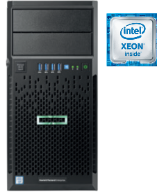
ProLiant ML30 Gen9