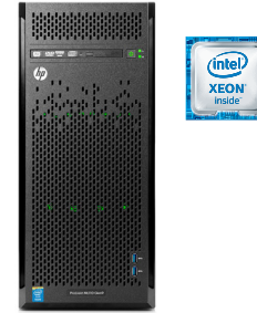
ProLiant ML110 Gen9