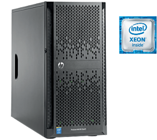
ProLiant ML150 Gen9