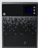
HP T750 G4 INTL Tower (525W) (1)

Recomendada para: • HP ProLiant ML110 • HP ProLiant ML150