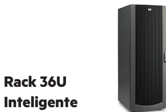
Rack 36U Inteligente