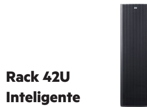
Rack 42U Inteligente