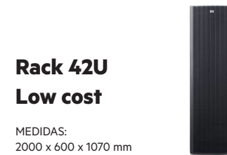
Rack 42U Low cost