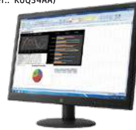
HP V241p (Ref.: K0Q34AA)