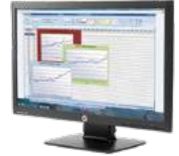
HP ProDisplay P222va LED (Ref.: K7X30AA)