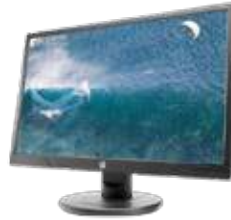
HP V212a (Ref.: M6F38AA)