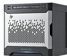
Top Value MicroServer Gen8