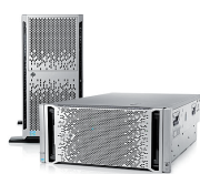
LIQUIDACIÓN DE EXISTENCIAS ProLiant ML350p Gen8 v2