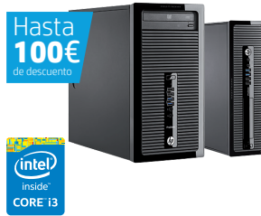
HP ProDesk 400 SFF/MT (Ref.: J8T18EA / K8K67EA)