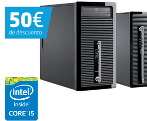
HP ProDesk 490 MT (Ref.: J4B09EA)