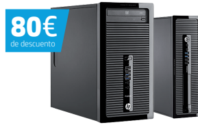
HP ProDesk 400 SFF/MT (Ref.: D5S21EA / J4B18EA)