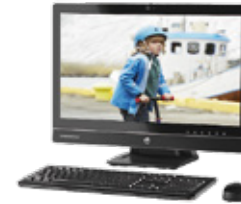
HP EliteOne 800 (Ref.: J4U67EA)