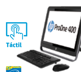
HP ProOne 400 (Ref.: F4Q64EA)