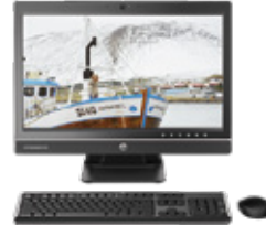
HP ProOne 600 (Ref.: J4U69EA)