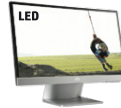
Pavilion 22xi (Ref.: C4D30AA)