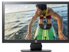
HP ProDisplay P221 LED (Ref.: C9E49AA)