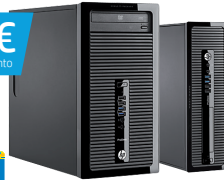
HP ProDesk 400 SFF/MT (Ref.: J8T18EA / K8K67EA)