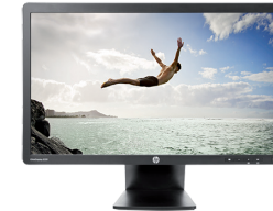
HP EliteDisplay E231 LED (Ref.: C9V75AA)