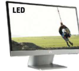
Pavilion 23xi (Ref.: C3Z94AA)