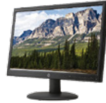
HP V201a (Ref.: F8C55AA)