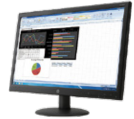
HP V241p (Ref.: K0Q34AA)