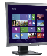
HP EliteDisplay E190i LED (Ref.: E4U30AA)