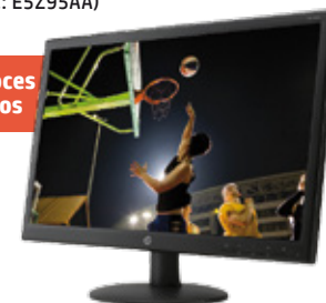
HP V241a (Ref.: E5Z95AA)