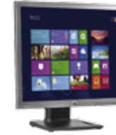
HP EliteDisplay E190i LED (Ref.: E4U30AA)