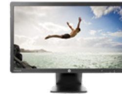
HP EliteDisplay E231 LED (Ref.: C9V75AA)