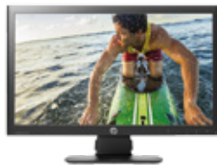
HP ProDisplay P221 LED (Ref.: C9E49AA)