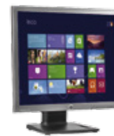
HP EliteDisplay E190i LED (Ref.: E4U30AA)