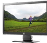
HP EliteDisplay E201 LED (Ref.: C9V73AA)