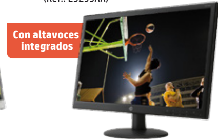
HP V241a (Ref.: E5Z95AA)