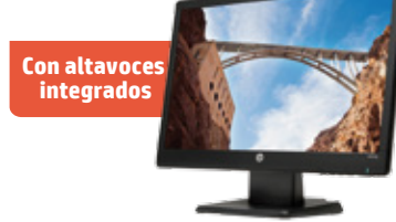
HP W2072a (Ref.: B5M13AA)