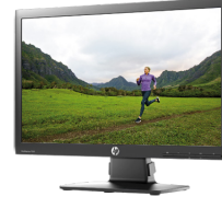
HP EliteDisplay E201 LED (Ref.: C9V73AA)