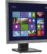
HP EliteDisplay E190i LED (Ref.: E4U30AA)