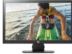
HP ProDisplay P221 LED (Ref.: C9E49AA)