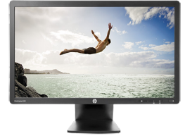
HP EliteDisplay E231 LED (Ref.: C9V75AA)