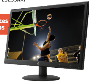
HP V241a (Ref.: E5Z95AA)