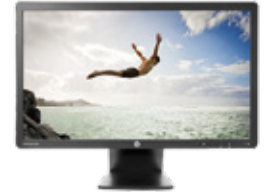
HP EliteDisplay E231 LED (Ref.: C9V75AA)