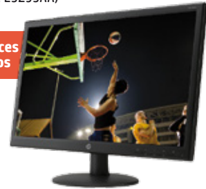
HP V241a (Ref.: E5Z95AA)