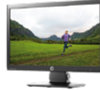
HP EliteDisplay E201 LED (Ref.: C9V73AA)