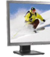
HP EliteDisplay E190i LED (Ref.: E4U30AA)