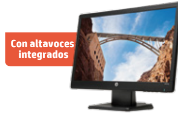
HP W2072a (Ref.: B5M13AA)